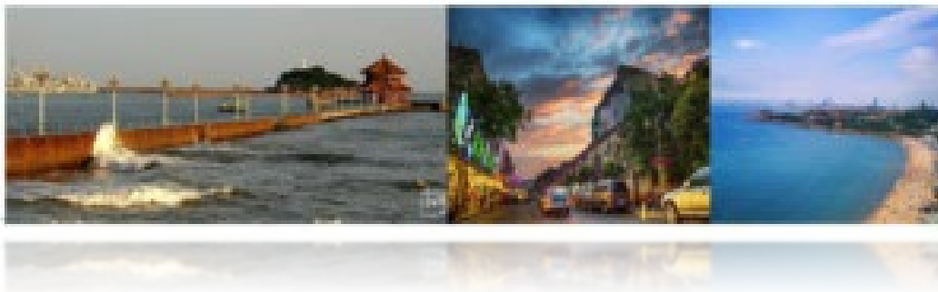
Fotos von Qingdao

Ich behalte mir ein Recht auf kleinere Änderungen vor